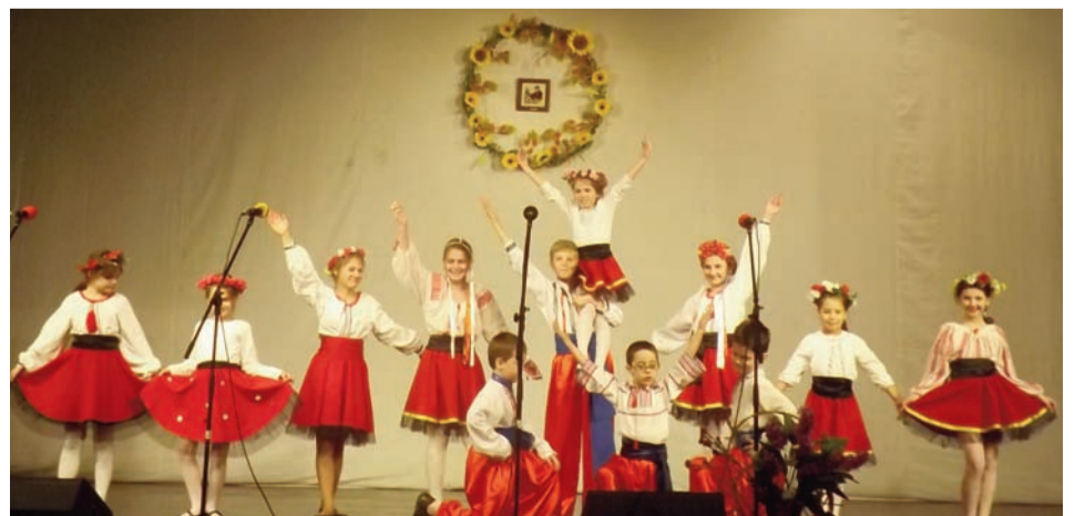
Дитяча група ансамблю «Задунайська січ»