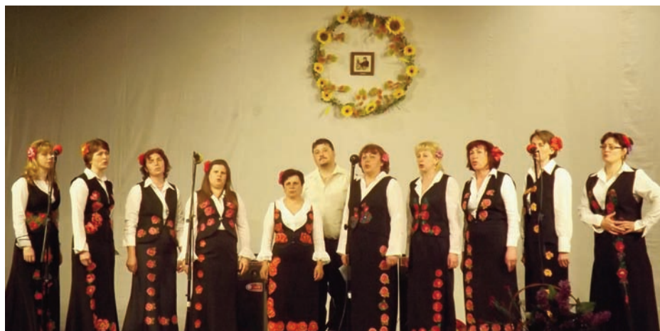
«Веселка» з Караорману