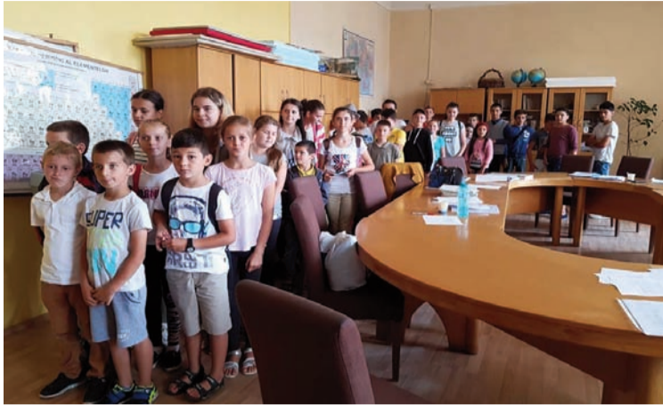
Elevii ucraineni din Micula la Liceul Ucrainean „Taras Șevcenko” din Sighetu Marmăției

Ca în fiecare an, filiala sătmăreană a UUR, organizează acțiuni dedicate copiilor care studiază limba maternă ucraineană din comuna Micula, județul Satu Mare.