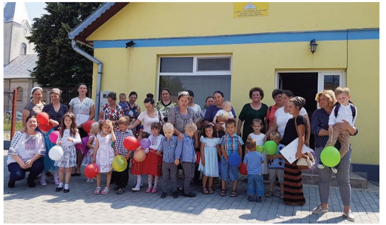
Preșcolarii secției de ucraineană alături de părinți la Ziua Copilului organizată la Micula

Excursia tematică a avut ca scop vizita copiilor ucraineni în organizații județene ale UUR din țară și școli unde se studiază limba maternă, dar și un program recreativ. Aceștia au vizitat Liceul Pedagogic „Taras Șevcenko” din