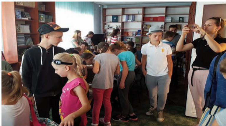
Elevii ucraineni din Micula la Biblioteca filialei Maramureș

Sighetu Marmăției și sediul filialei Maramureș a UUR.