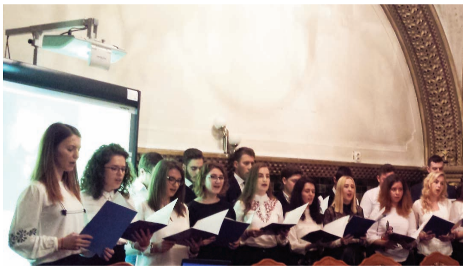
Corală UUR Cluj