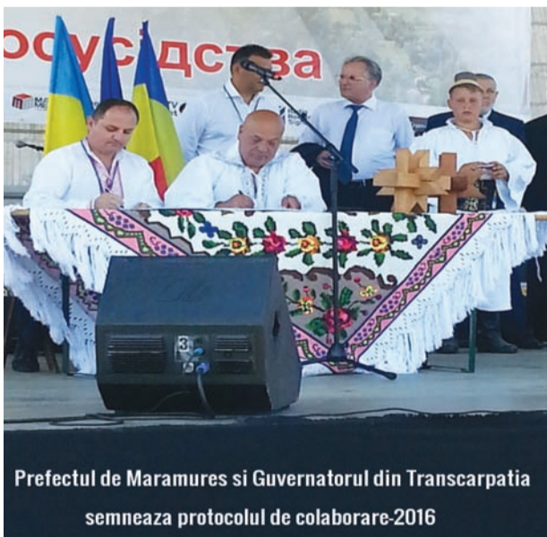
Prefectul de Maramures si Guvernatorul din Transcarpatia semneaza protocolul de colaborare-2016