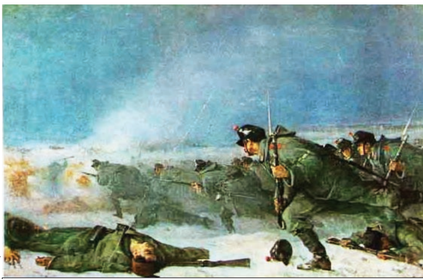
N. Grigorescu, Atacul de la Smârdan

Victoria asupra fascismului în cel de-al Doilea Război Mondial a constituit un eveniment grandios al secolului al XX-lea care a reunit toată lumea progresistă globală și a devenit un fundament esențial pentru construirea unei Europe moderne și unite.