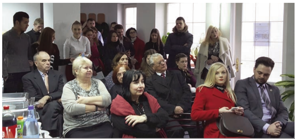
O parte dintre participanți

schimbarea numelor zeităților păgâne cu cele ale personajelor creștine. De exemplu, repetiția «Ой, Даждбоже!» s-a schimbat în «Ой, дай Боже!» sau «Дай же, Боже!» („Dă Doamne!”). Colindul „Добрий вечір тобі, пане господарю” reprezintă un exemplu elocvent de îmbinare a elementelor precreeștine (imagea pâinii, a semințelor, masa sfântă, motivul vizitei) cu cele creștine.