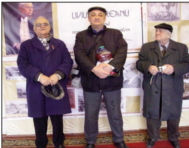
Societatea Culturală „M. Eminescu” din Cernăuți.

Expoziția, dedicată „Zilei Culturii Naționale” a fost organizată cu sprijinul direct al Institutului Cultural Român „Mihai Eminescu” din Chișinău, în colaborare cu Consulatul General al României din Cernăuți și