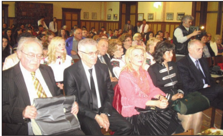
Aspect din sală