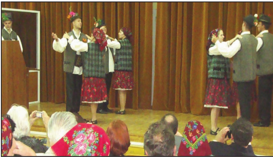
„Sokoly“ pe scena amfiteatrului „M. Eminescu“ (Facultatea de Litere)