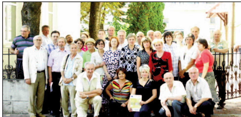
Participanți la acțiunea din Suceava

Cele două reuniuni s-au dovedit extrem de folositoare nu numai pentru participanți, ci mai ales pentru cele două instituții publice - pentru