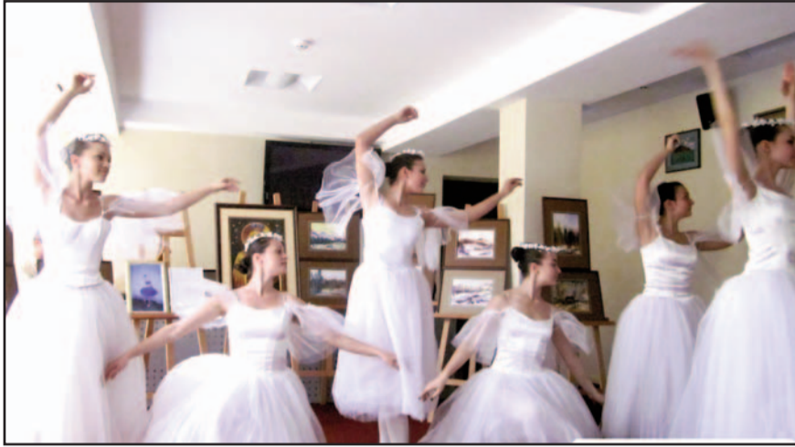
Colegele de la clasa de balet a Taisei

Departajarea concurenților a fost făcută de un juriu format din 15 persoane, care a avut o