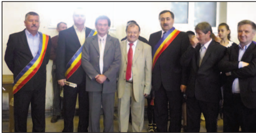
Oficialități prezente la cinstirea veteranilor de război