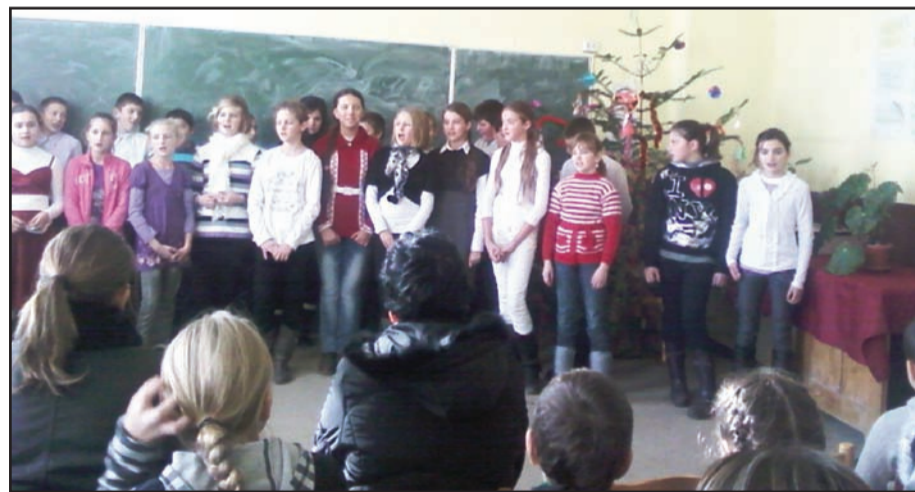
Spectacolul dat de elevi

Astfel, corul religios „Lăudăm pe Domnul“, format tot din elevii