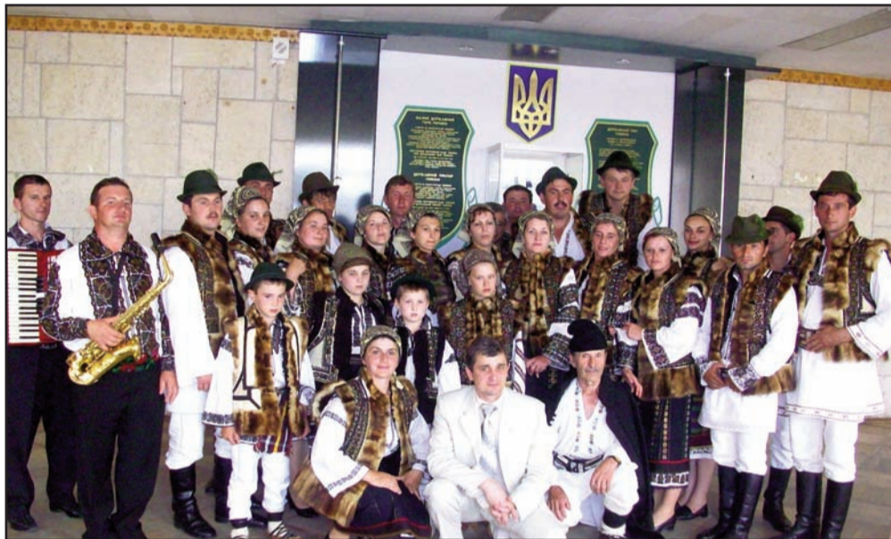
Ansamblul mixt „Rodniciok-Gura Izvorului”, localitatea Vatra Moldoviței

Latura comică a petrecerii până târziu în noapte a continuat a doua zi dimineață când, un echipaj al poliției din zonă, care a auzit veselie, a verificat seriozitatea domnului Filuță, șoferul unui microbuz nou-nouț de care se