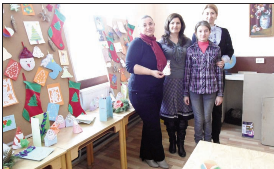
Expoziția și organizatoarele expoziției