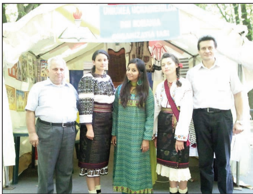
Participanți la Târgul Multicultural

Cu toate greutățile cu care ne confruntăm în prezent, programul pregătit și prezentat s-a bucurat de un real succes, fiind aplaudat de sute de spectatori, care se aflau la acea oră în Parcul Expoziției. Desigur programul putea fi mult mai bogat, dar ca urmare a lipsei de costume și