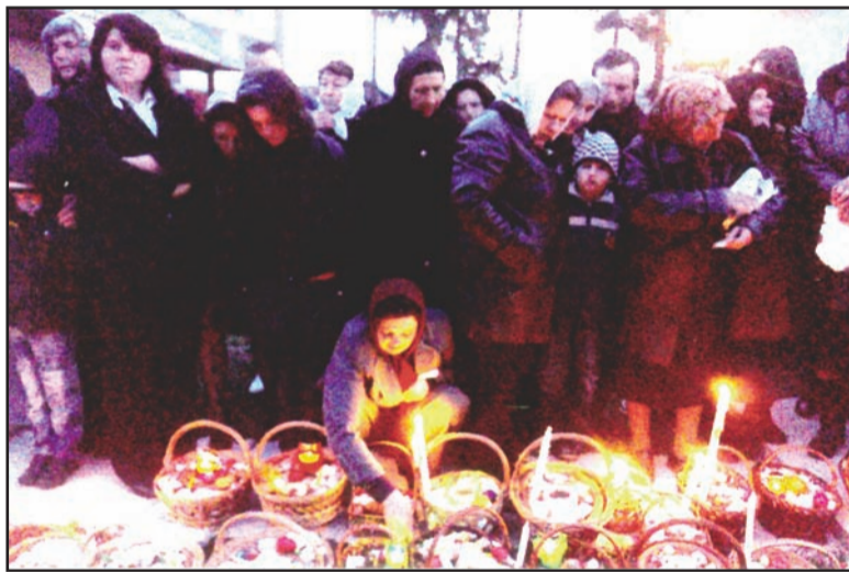
Cu coșuri la sfințit în curtea bisericii la Rogojești de Sf. Paști

În sâmbăta Paștilor gospodinele pregătesc mâncarea tradițională: fierb cărnații într-un singur clocot, ouăle nevopsite, piftia, drobul de miel la cuptor, friptură, pregătesc diferite salate: cea de hrean cu sfeclă roșie, mai ales, apoi alte salate de legume cu ouă și cu carne, fierb și slăninuță într-un singur clocot. Au grijă din timp să aibă în casă și caș proaspăt de oi. Tot în această sâmbătă mai coc și prăjituri.