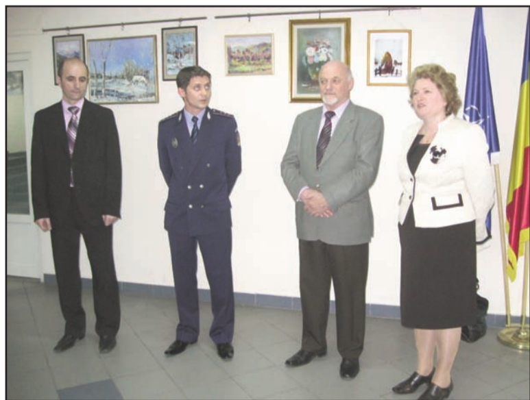
Vernisajul expoziției de pictură de la Galeria „Millenium”