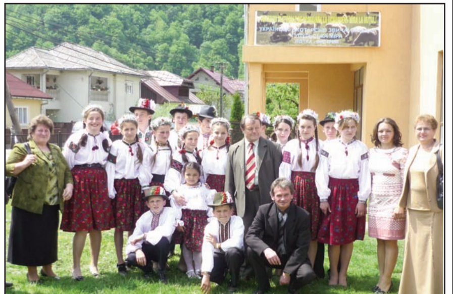
Ansamblul artistic din Valea Vișeului prezent la manifestare

În Țara Oașului, acest obicei se numește „sâmbra oilor”, în Țara Lăpușului - „măsurîșul”, iar la ucrainenii de la munte - „mira”, care înseamnă „măsurîș” sau măsurarea cantității de lapte pe oaie. Obiceiul datează dintotdeauna, de când se adunau oile la stână pentru a se deplasa la munte pe timp de vară. Obiceiul s-a statornicit și la huțulii din satele Crasna Vișeului și Valea Ruscovei din județul Maramureș, la huțulii din județul Suceava și la cei din Munții Carpați ai Ucrainei, în raioanele Rachiv, Verchovyna și Putyla.