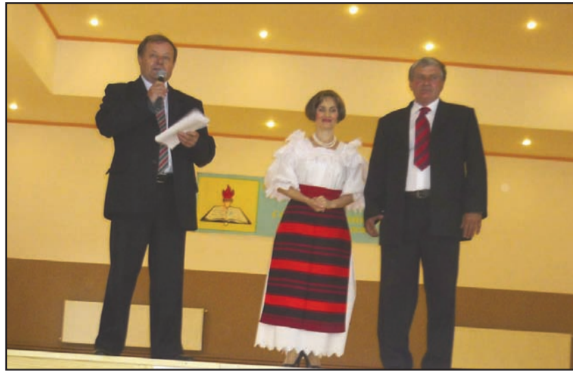
Aspect de la manifestare

transportat în Ucraina, la Kaniv, unde a fost reînhamat pe muntele care îi poartă acum numele și unde există un monument gigant și un muzeu dedicat lui (Șevcenkova hora).