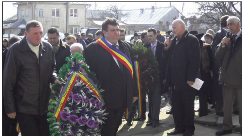
Aspect de la depunerea de coroane

Putna este sărbătorit geniu românesc, în a doua decadă a lunii martie. Bucovina îl sărbătorește pe Taras Șevcenko (n. 9.III.1814, m. 10.III.1861) împreună cu tot mapamondul, unde trăiesc ucrainenii și toți prețuitorii marelui Cobzar. Conform tradiției, toate serbările Șevcenko din Bucovina de Sud încep la Negostina, unde se organizează parastasul marelui poet la biserica „Sfântul Dimitrie“ din sat, apoi se depun flori la monumentul poetului, se susține un program artistic în sala Căminului Cultural „Nazarie Iaremciuk“.