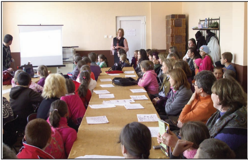
Aspect din sala de clasă