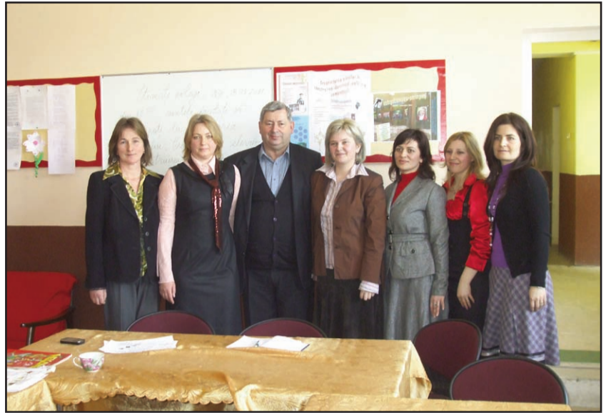
Profesori de la Școala din Rona de Sus