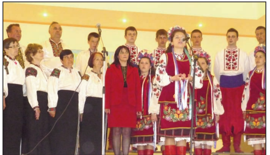
Corul „Vocile Ronei“