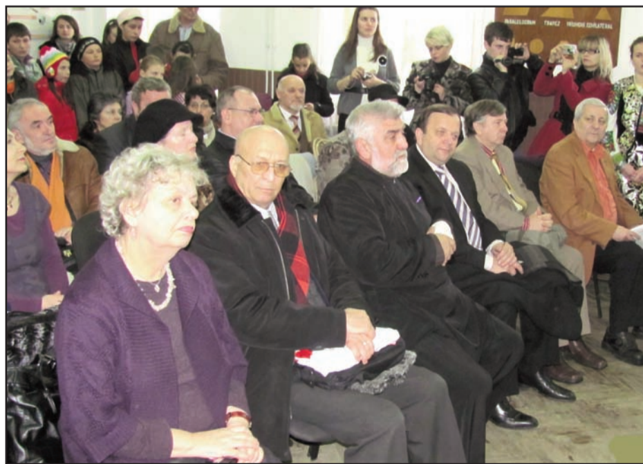
Aspect din sală