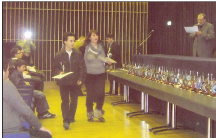
Aspect de la momentul festivității de premiere