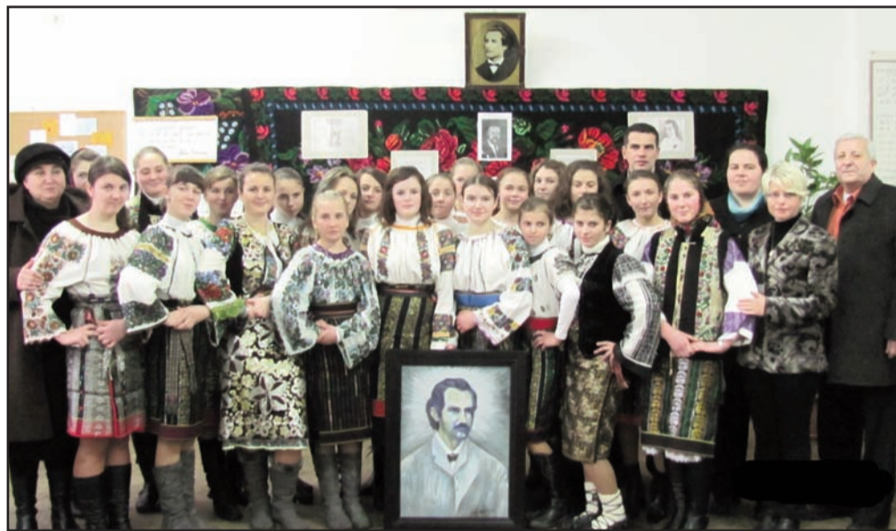
Grupul de elevi din Călinești-Cuparencu și Șerbăuți