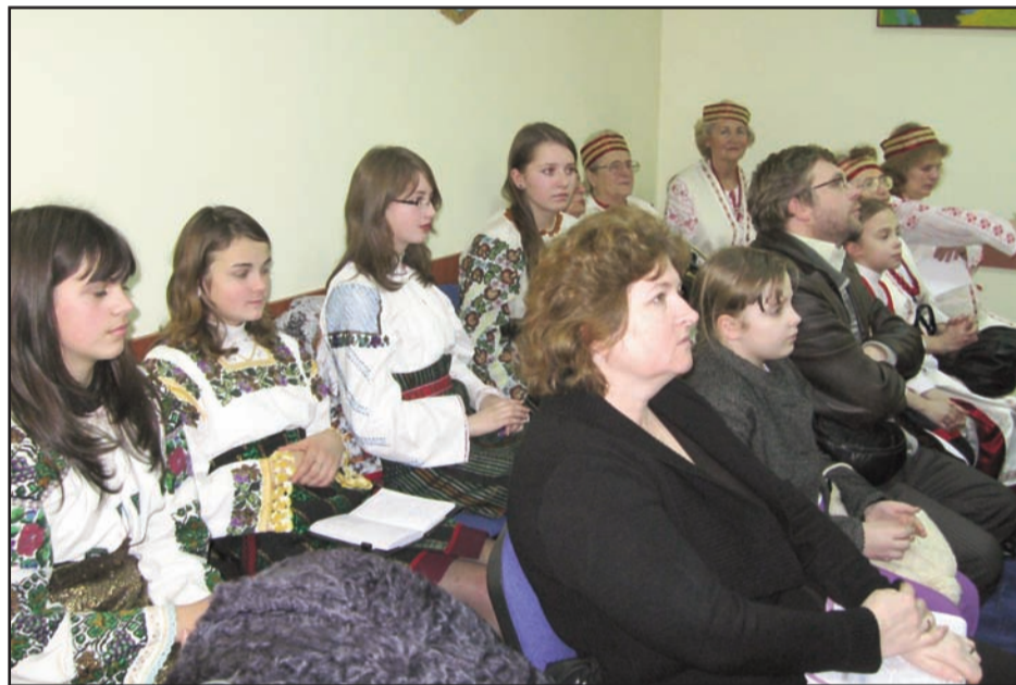
Aspect din cadrul manifestării