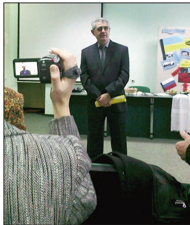
Dl consul general amintindu-și de anii când era și dumnealui profesor