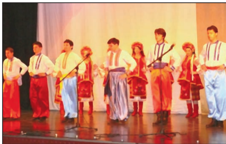
Ansamblul „Zadunaiska Sici” pe scenă