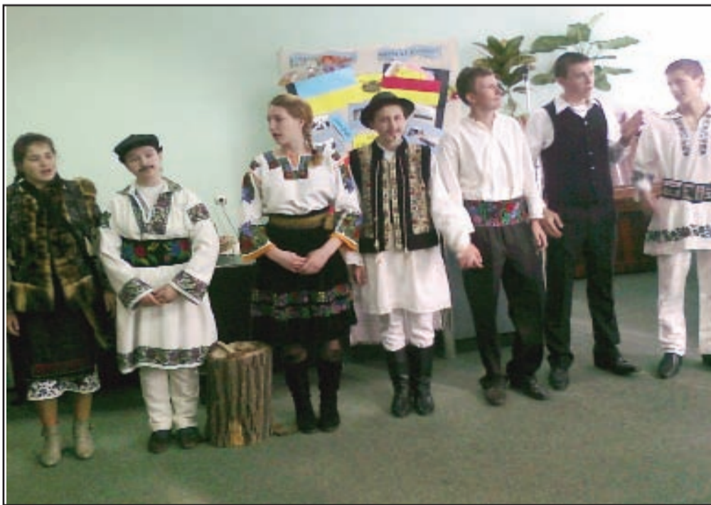
Actorii-elevi la finalul spectacolului

variantă a acestui text. Am citit astfel, Povestea lui Hansel cel rău, a lui Gretel cea supărată și a vrăjitoarei de Paul Maar. Și astfel ne-a venit ideea de a scrie noi o variantă a acestei povești, cu personaje care se regăsesc printre noi. Astfel, Hansel și Gretel au devenit elevi la Colegiul Național „Mihai Eminescu”, iar Vrăjitoarea este chiar profesoara de limba germană. Nu este însă o vrăjitoare oarecare, ci mai degrabă eine Fee, care face magie prin vorbe. Ea ne învață cuvinte care aduc zâmbete, cuvinte care întristează, cuvinte care ne ascut mintea, cuvinte cu care regăsim drumul spre casă, cuvinte care ne deschid drumul în viață!!!” Activitatea demonstrativă la limba ucraineană maternă a fost susținută de elevi din clasele a IX-a, a X-a, a XI-a care studiază limba ucraineană ca limbă maternă în cadrul Colegiului Național „Mihai Eminescu”, coordo-