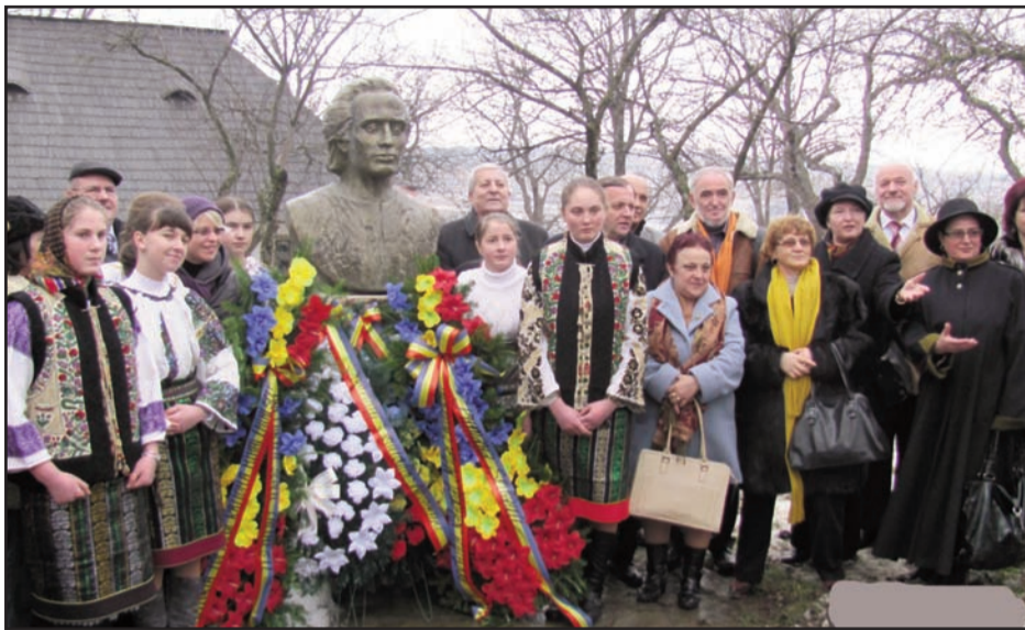
La bustul poetului Mihai Eminescu

Școlii cu cl. I-VIII „Grigore Ghica Voievod“ Suceava, școală parteneră cu Școala din Călinești în cadrul proiectului „Prin tradiții deschidem porțile prieteniei“. Oaspeții s-au arătat deosebit de încântați de minirecitalul la care au asistat, în mod special s-au evidențiat