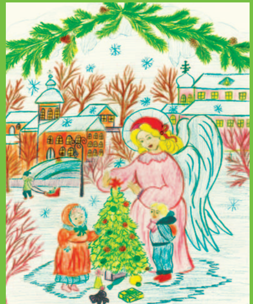
Вікторія НІКОЛАЄЦЬ, 12 років