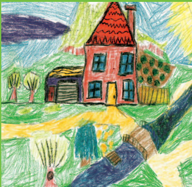
Степан-Крістіан ТРАЙСТА, 4 клас, с. Верхня Рівна