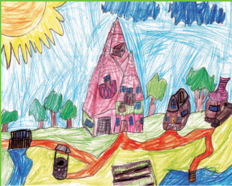
Степан-Крістіан ТРАЙСТА, 4 клас, с. Верхня Рівна

З Новим роком вас, наші дорогі маленькі читачі! З Різдвом Христовим!