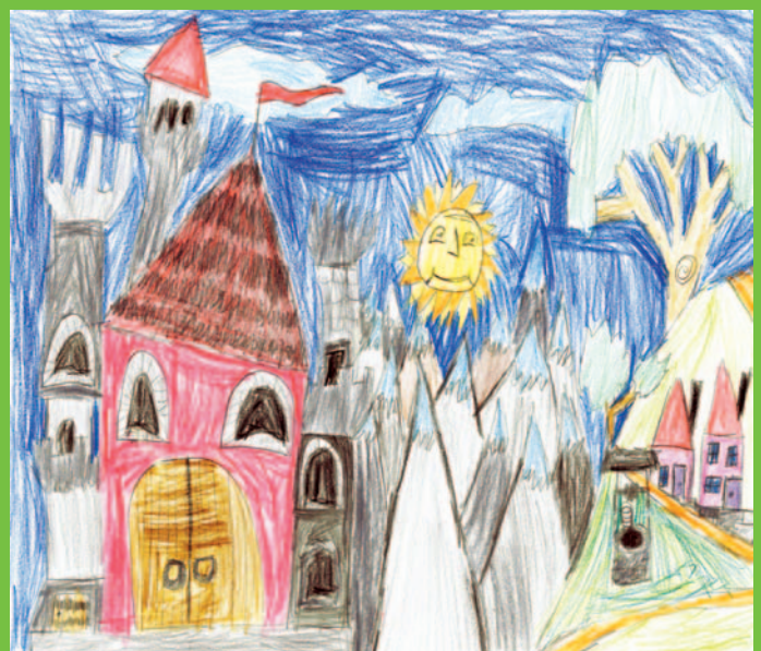
Степан-Крістіан ТРАЙСТА, 4 клас, с. Верхня Рівна