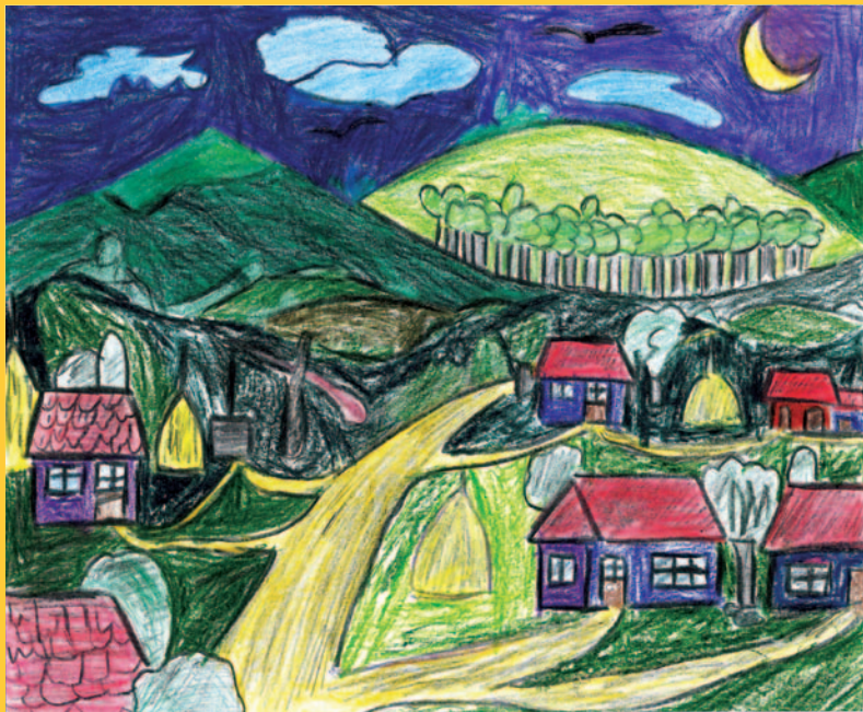
Степан Крістіан Трайста, 6 клас, с. Верхня Рівна