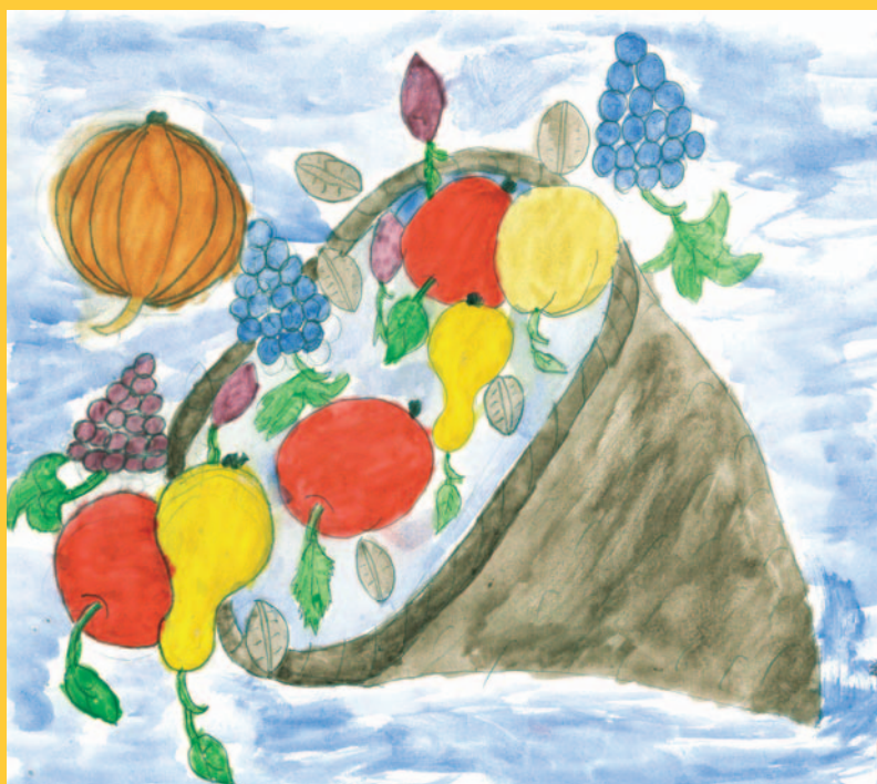
Біанка Дубей, 5 клас, с. Верхня Рівна