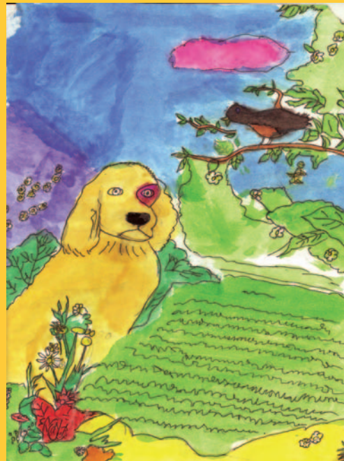
Біанка Дубей, 5 клас, с. Верхня Рівна