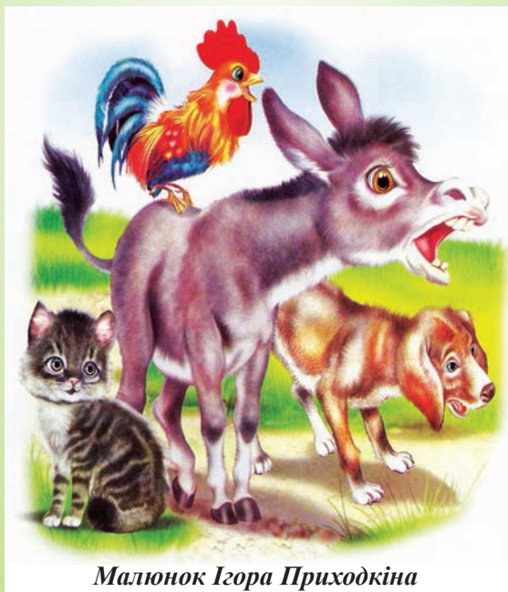
Малюнок Ігора Приходкіна