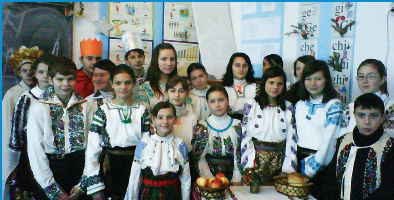
Гурт школярів «Буковинка» із с. Балківці