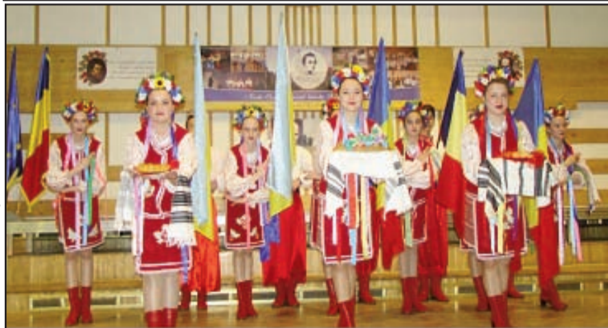
Вітальний танець ансамблю «Козачата» з м. Сучава