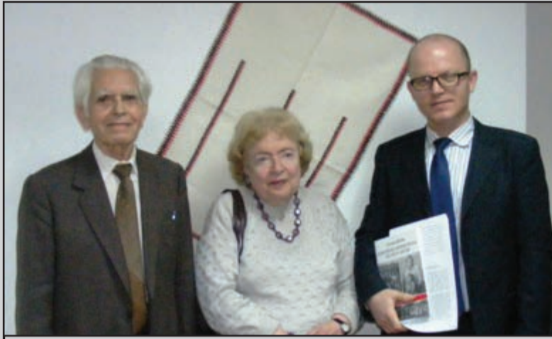
Генерал М. Покорський, О. П.-Андрич і В. Гузун