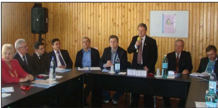
Учасники Міжнародного симпозиуму

Голова Секретаріату Товариства «Україна Світ»