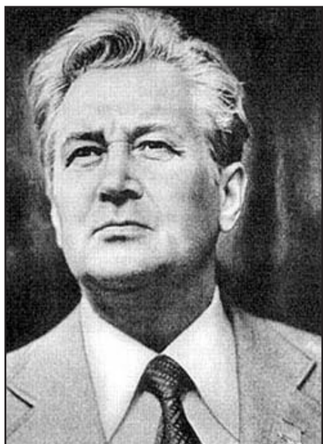
Гончар Олесь Терентійович 03.04.1918—14.07.1995

Український письменник, літературний критик, громадський діяч, перший лауреат премії імені Тараса Шевченка (1962), голова Співки письменників України (1959 – 1971), академік НАН України (1978)