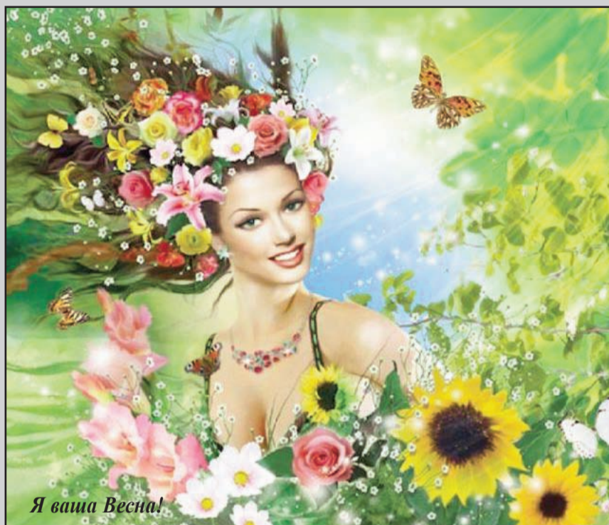
Я ваша Весна!

Подумаймо і побажаймо всім дітям України, щоб в ці дуже трудні і нелегкі дні небо було чисте,