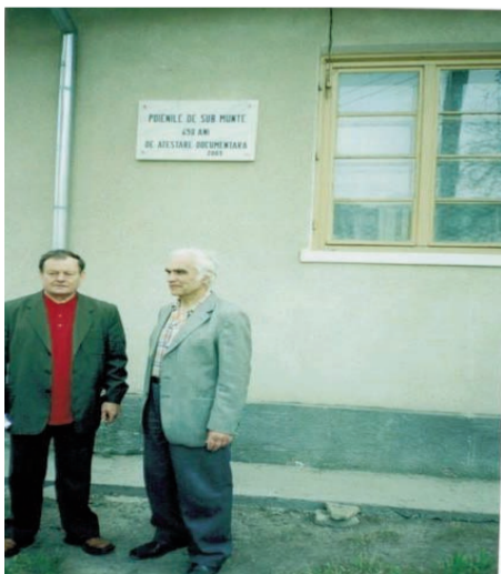
650 de ani de atestare documentară a comunei Poienile de sub Munte – 2003