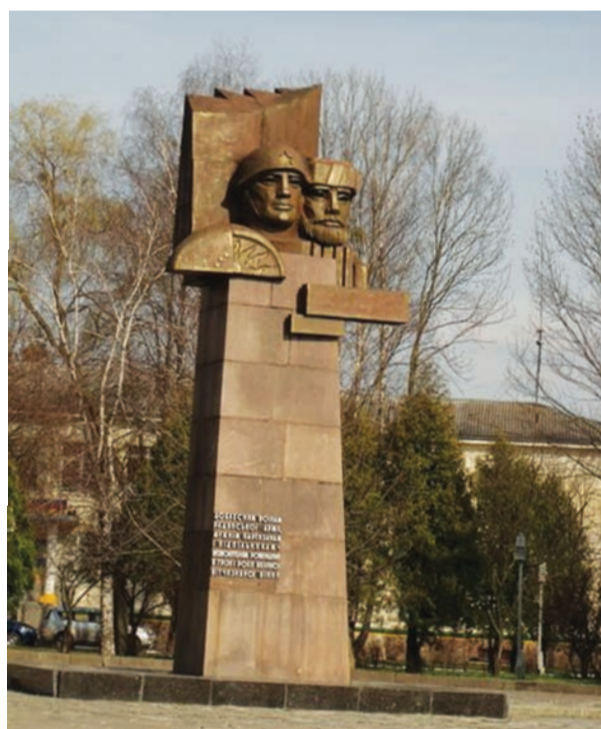
„Eliberatorii”, Kiev (1972)

După victoria asupra Germaniei naziste, la 8 mai 1945, URSS s-a alăturat luptei împotriva