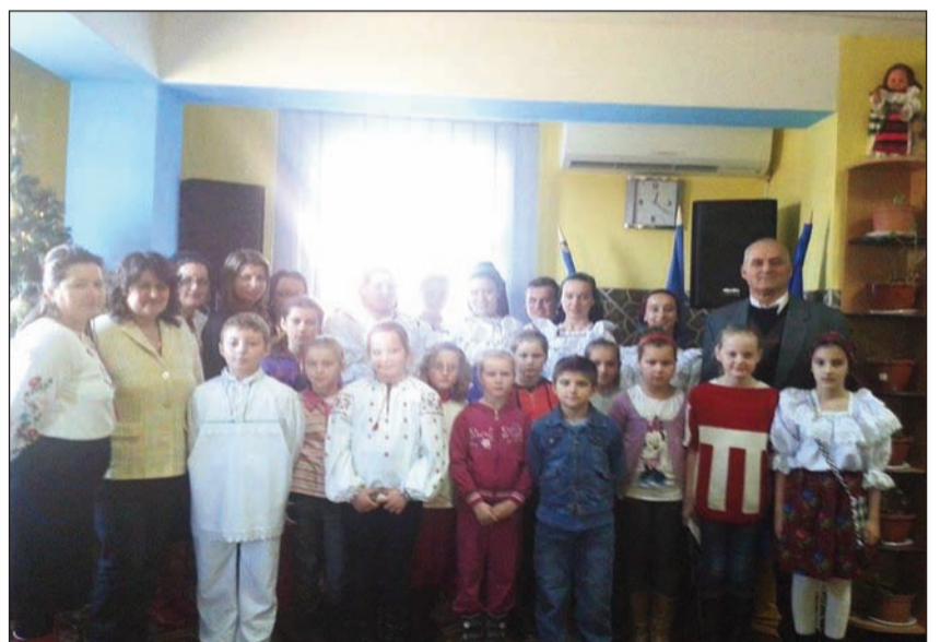
Colindători de la Școala Gimnazială Tîrnova

Sediul UUR-filia la Arad din localitatea Tîrnova a fost plin în seara zilei de sâmbătă, 20 decembrie 2014, iar colindătorii îmbrăcați în costume populare au fost și ei numeroși.