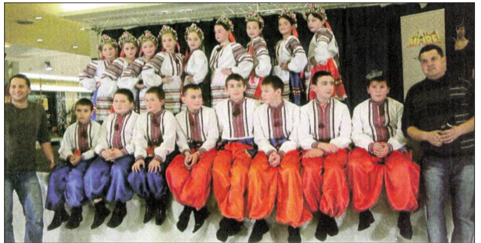
Ansamblul „Cervona kalyna” din Negostina