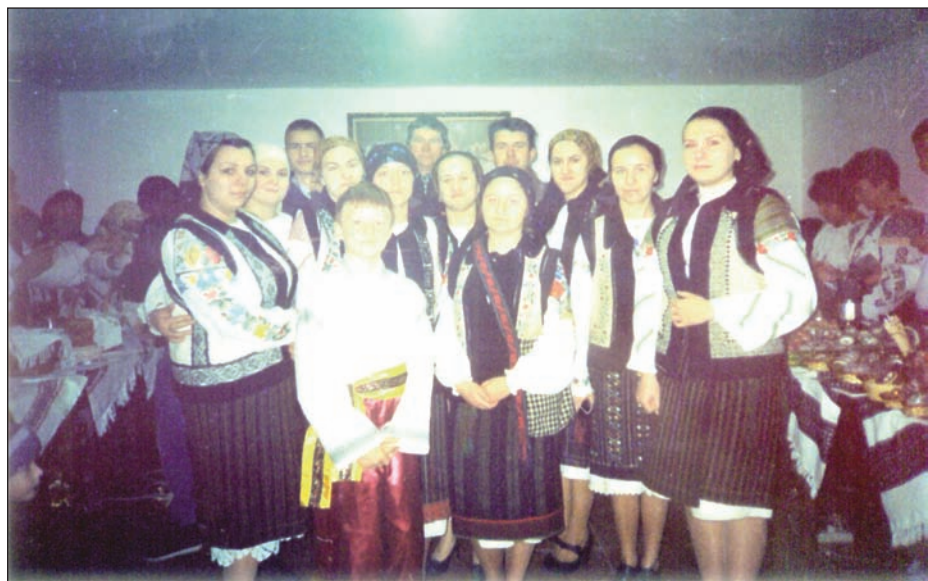
Grupul vocal „Vesna” din Rogojești