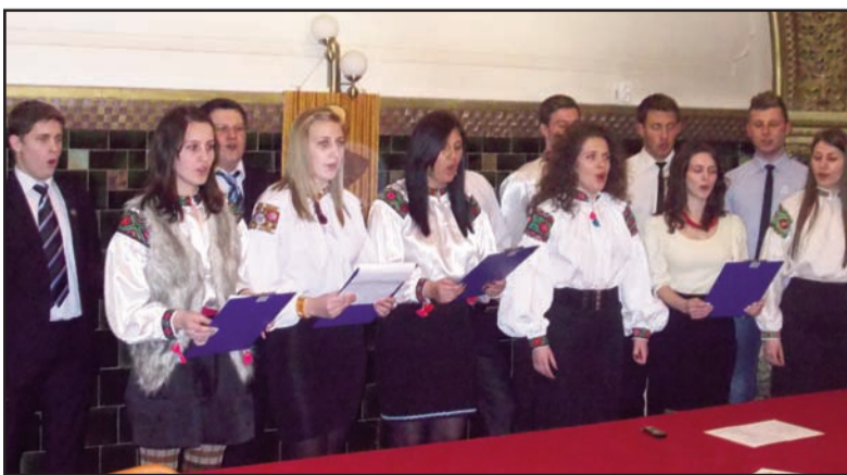
Corală filialei clujene a UUR