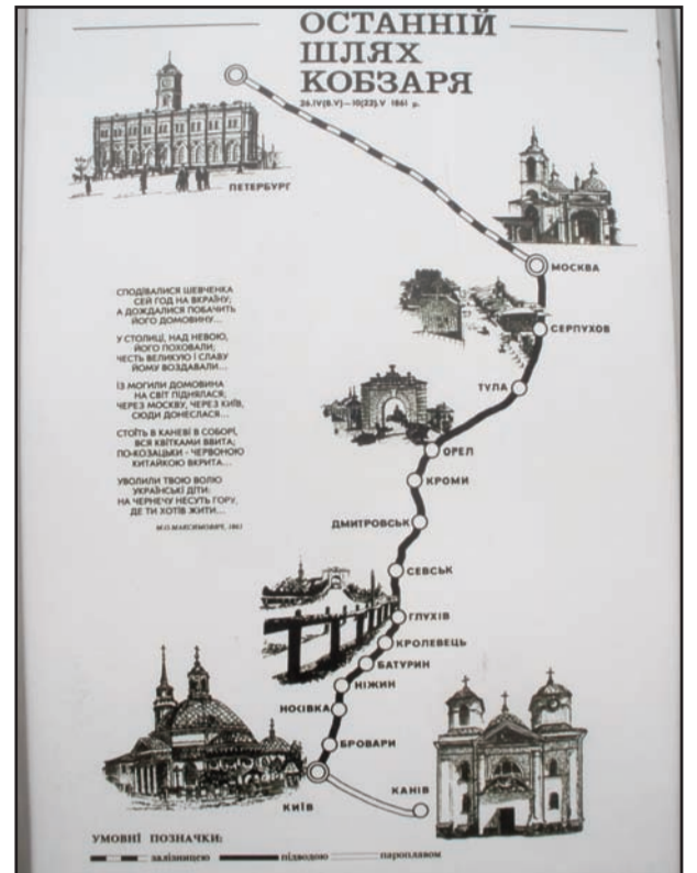
Ultimul drum parcurs de Șevcenko (Petersburg-Kaniv)

Dl Miculaiciuc Gavrilă, președintele filialei arădene a UUR, le-a mulțumit în mod cordial tuturor aceluia care au depus eforturi pentru ca această activitate culturală să aibă loc, solicitând părinților și celor „în care mai curge sânge de ucrainean“ să participe activ la astfel de manifestări.