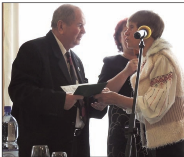
Cobzarul națiunii noastre, Taras Hryhorovyci Șevcenko.

Această diplomă încununează strădaniile întregii noastre comunități de a păstra tradițiile și valorile patrimoniului cultural al ucrainenilor și eforturile noastre pentru valorificarea tezaurului literar și artistic lăsat moștenire de