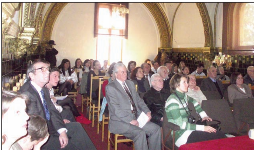
Aspect din timpul manifestării (sala D. Popovici a Facultății de Litere, Cluj-Napoca)