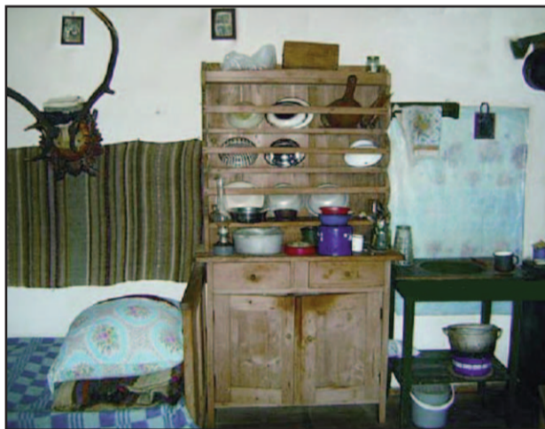
Blidar – Izvoarele Sucevei