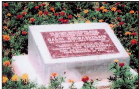
Piatra de temelie cu inscripție bilingvă ucraineană și română.

... Era o zi de duminică, 3 noiembrie a anului 2002, o veritabilă zi de toamnă așa cum este dat să vedem numai în Bucovina. Era o duminică obișnuită, dar în același timp deosebită pentru orașul Gura Humorului din județul Suceava. În acea zi, în acest oraș care, pe atunci, încă nu avea statut de oraș-stațiune turistică și, în consecință, era mai puțin cunoscut, a avut loc un important eveniment cul-