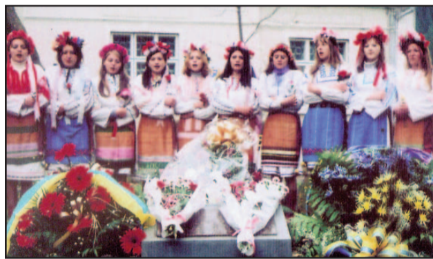
Grupul folcloric „Strunele Negostinei”

Cei care au luat cuvântul au reliefat importanța evenimentului atât pe plan