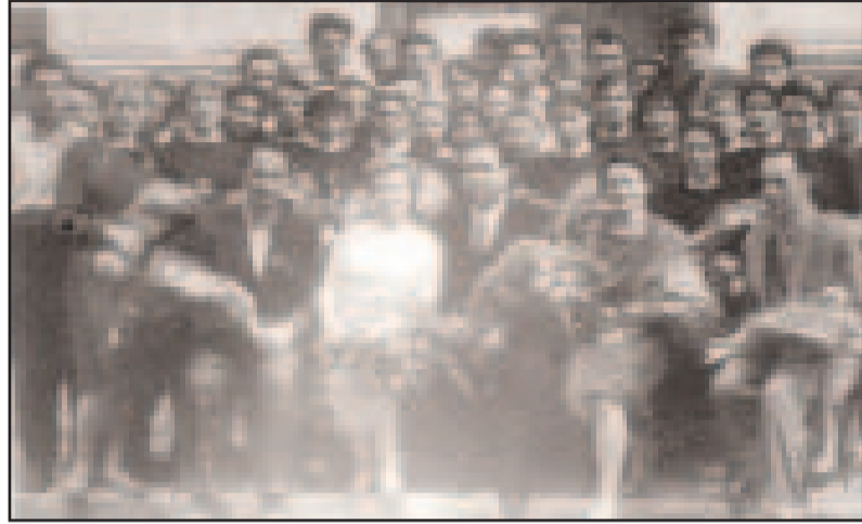
La absolvire - 1962

Este mijlocul lunii septembrie. Într-adevăr, e toamnă de aur. Peste tot se strâng roadele toamnei bogate în Bucovina și nu numai. 15 septembrie 2012 a ajuns o zi îndelung așteptată nu pentru deschiderea anului școlar, ci pentru reîntâlnirea, după 50 de ani, a foștilor absolvenți ai clasei a XI-a, secția ucraineană (promoția 1962) de la Școala Medie Mixtă Ucraineană din Siret.