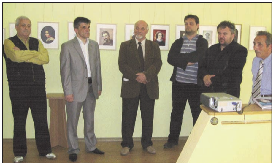
Participanți la Galeria „Taras Șevcenko“