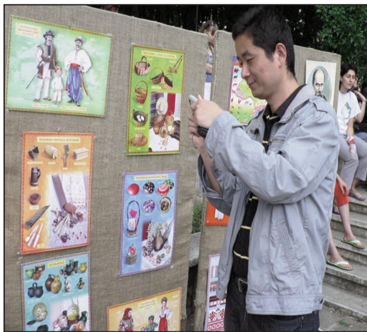
Un vizitator admirând frumoasele creații

Toată lumea a apreciat că a fost un program reușit, ceea ce îi va determina pe organizatori să-l îmbunătățească și să-l diversifice la următoarea ediție. Programele fiecărei culturi urmează să devină mult mai diversificate și să se întindă pe durata unei zile întregi, să fie prezente cu standuri de artă populară, cu muzică și dans, cu teatru, cu parada portului popular, cu