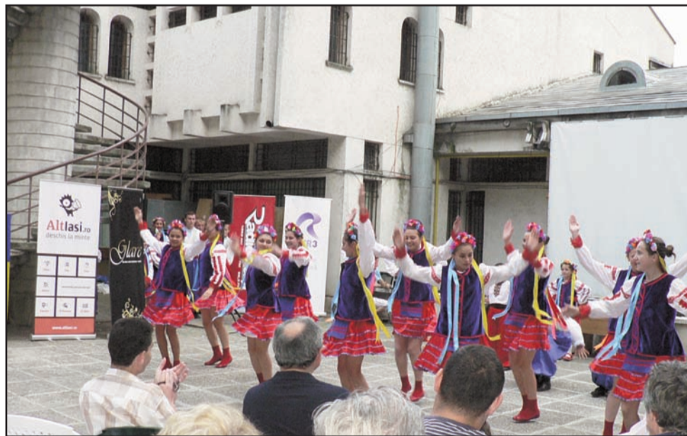
Formația „Kozaciok“ din comuna Bălcăuți

îmbunătățit în fiecare an, având în centru ideea de comunicare multiculturală, de unitate în diversitate și armonie. Festivalul a fost conceput a se desfășura în aer liber, tocmai pentru a facilita accesul unui număr cât mai mare de persoane.