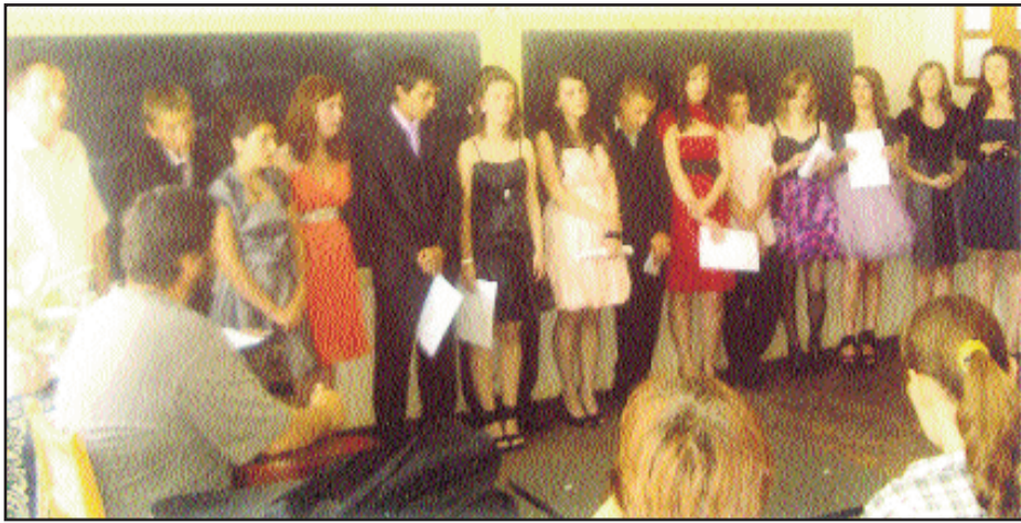
Elevi la sfârșitul anului școlar

Am avut prilejul să particip la ora de despărțire a elevilor clasei a VIII-a de la Școala cu clasele I-VIII din Măriței, comuna Dărmănești, județul Suceava.