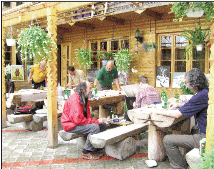
Aspect din cadrul evenimentului

Prin reorganizarea spațiului de care dispunea filiala, a fost amenajată, inaugurată și sfințită de un sobor de preoți Galeria „Taras Șevcenko”, unde sunt expuse un număr de 51 de fotocopii după lucrările de grafică și pictură ale artistului ucrainean.