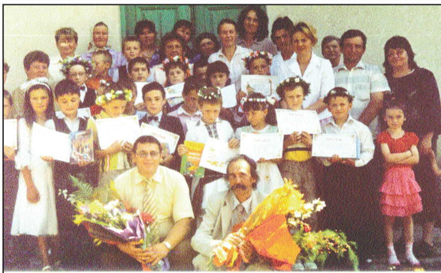
Elevi, profesori și părinți

E o zi plină de soare, de cer albastru, de verde și flori, de păsări și de cântecele lor. Se disting rândunelele harnice care zboară de coloro, vrăbiuțele care parcă se joacă printre crengele pomilor, dar și gugustiucii care se spală pe vârful gardului înalt de fier. Mai dinspre pâraul Molnița, care taie satul în două părți și curge la doi pași de clădirea școlii, se aude dintre crengele copacilor de pe mal un „cu-cu“ repetat și atât de clar și melodios, încât cu greu mă abțin să nu-l îngân, așa cum fac atunci când mă aflu în livada mea. Dar aici unde sunt acum, în curtea Școlii din Rogojești, îi răspund cucului doar în gând, fiind atrasă de chipurile pline de bucurie ale școlărilor și preșcolărilor, care oglindesc nerăbdare, curiozitate, vervă, entuzi-