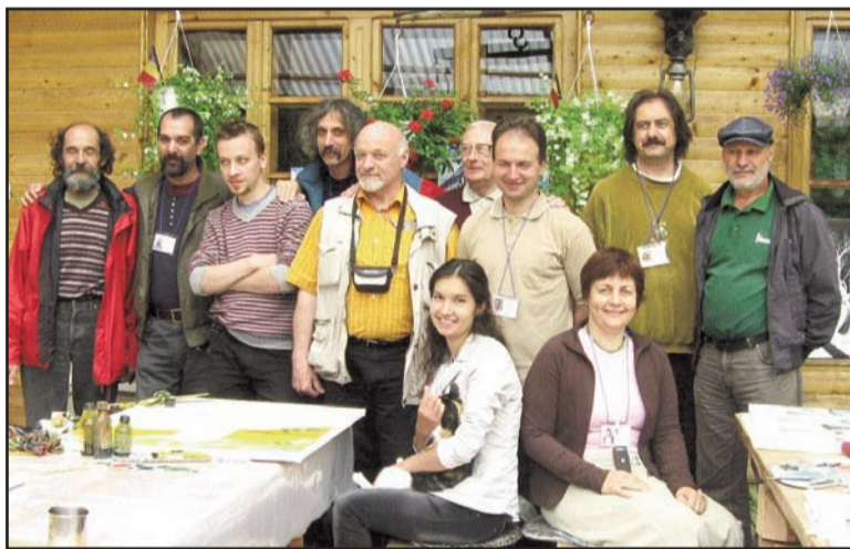
Artiștii plastici participanți la cea de-a V-a ediție a Taberei

La ediția din acest an, alături de câțiva veterani ai taberei, care au participat și la edițiile anterioare, sunt și noi veniți, unii dintre ei aflându-se pentru prima oară în România.