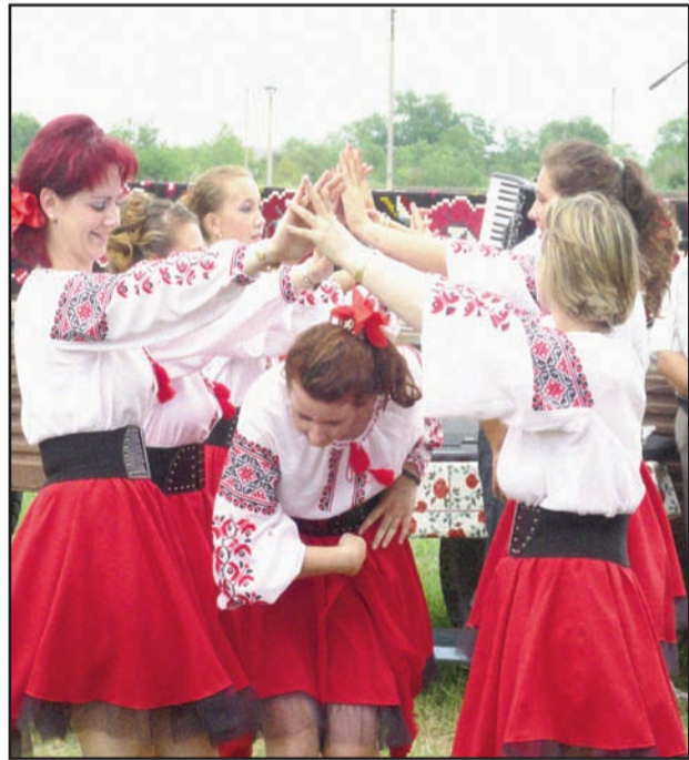
Ansamblul de tineret „Zadunaiska Sici”