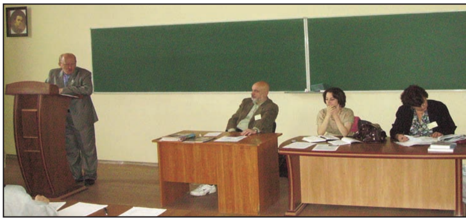
Aspect din cadrul evenimentului