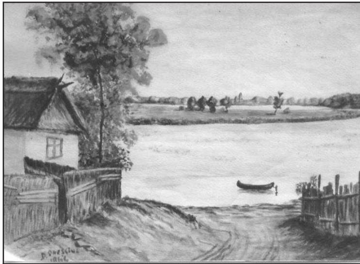
La malul Dunării

Printre ultimele picturi ale sale se numără și peisajul pictat în acuarelă, pe malul Dunării, la Murighiol, în anul 1964, când, la invitația unor foști elevi ai săi, a făcut, împreună cu soția, o călătorie prin Deltă, în localitățile locuite de ucraineni – urmași ai vechilor cazaci zaporojeni.