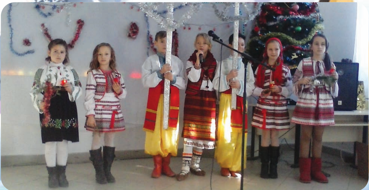
Члени шкільного ансамблю «Козачок», с. Балківці