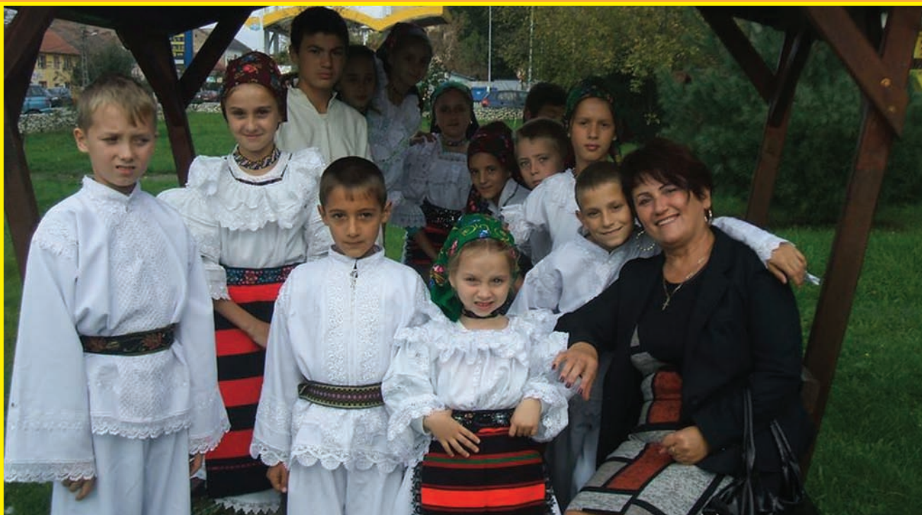
Учні школи с. Беліу