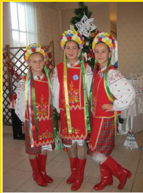
Учениці школи с. Тирнова